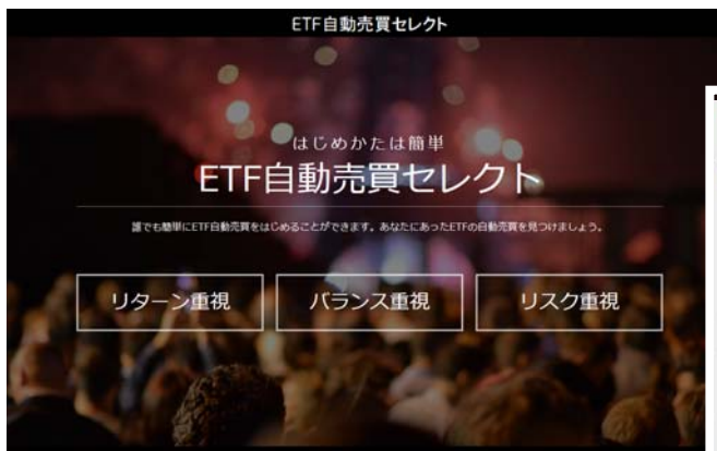
ETF 自動売買セレクト画面

トライオートETFの新機能「ETF 自動売買セレクト」は、投資スタイルを選ぶだけで自分に合った銘柄を簡単に選択して、自動売買を使ったETFの資産運用を簡単に始めることができる機能です。投資初心者の方、ETFや自動売買に馴染みのない方でも迷うことなく海外ETF投資を始めることができます。