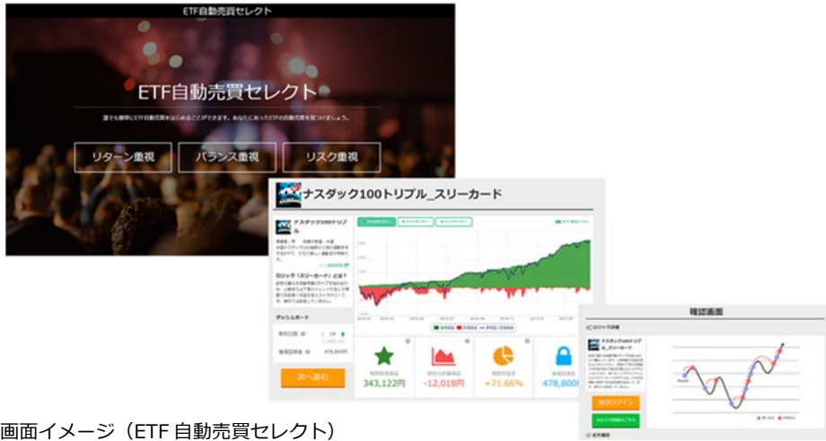
画面イメージ (ETF 自動売買セレクト)

トライオート ETF では、投資スタイルに合わせて選ぶだけの「自動売買セレクト」や、ご自身で銘柄を選び自動売買の設定を作成できる機能など、初心者から投資経験者までニーズに沿った自動売買機能をご用意しております。利用料、取引手数料は全て無料ですので、取引コストを気にせずお取引いただけます。