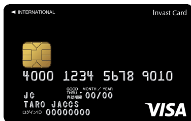
インヴァストカードイメージ

クレジットカード利用額の1%が投資原資としてキャッシュバックされます。 インヴァストカードのお申込は、マネーハッチから行っていただけます。