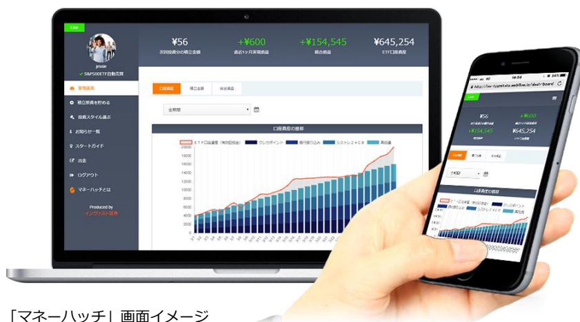
「マネーハッチ」画面イメージ

マネーハッチは、投資初心者の方でも投資を体感できるよう「元手ゼロから」「投資を体感できる成績」「シンプルだけど楽しめる柔軟性」を大切にしています。投資を体感することで、投資に関する知識や必要性、楽しさを学んでいただきたいと考えております。