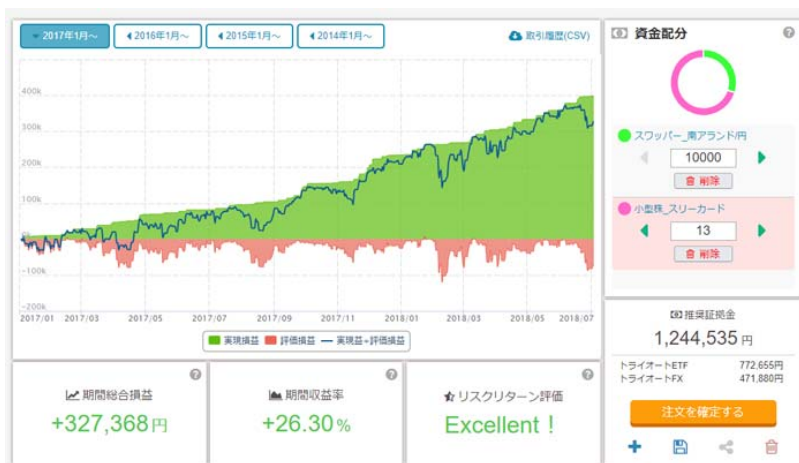
※カート機能画面イメージ