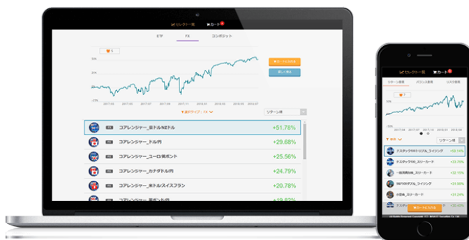
「自動売買セレクト画面」イメージ

「自動売買セレクト」は、銘柄（ETF）や通貨ペア（FX）と自動売買ロジックの組み合わせを収益率などから選ぶだけで自動売買取引ができるインヴァスト証券のオリジナルツールです。複数銘柄でポートフォリオを組んだ際のシミュレーションも一目で確認、変更できるため、初心者の方でも手軽に自動売買取引を始めることができます。