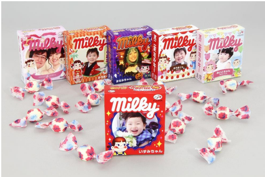
ペコちゃん、ポコちゃん、ペコラちゃんとコラボできるマイミルクィBOX