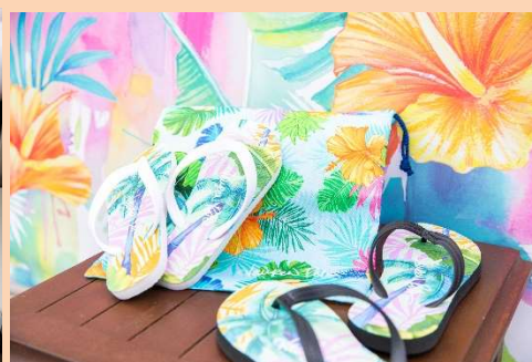
ローレン・ロス氏デザインの 品川プリンスホテルオリジナルグッズ ローレンロス・ジャパン株式会社