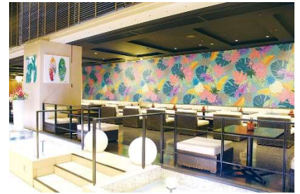
LUXE DINING HAPUNA 装飾された店内