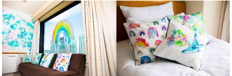
コラボレーションルーム

【内容】 ・ローレン・ロス氏コラボレーションルーム ・「LUXE DINING HAPUNA」の朝食