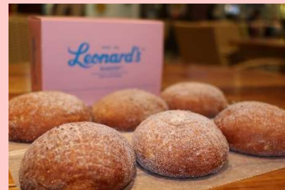
ハワイ在住の方や観光客に 人気の「レナーズ」のマラサダを LUXE DINING HAPUNA にて 期間限定でご提供

©本件に関する報道各位からのお問合せは 品川プリンスホテル マーケティング戦略 TEL: 03-5421-7827(直通) FAX: 03-5421-7893