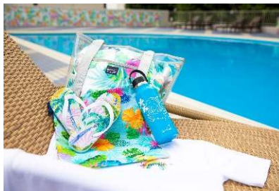
ローレン・ロス氏 オリジナルグッズ

・ローレン・ロス氏×品川プリンスホテル限定オリジナルグッズ(Tシャツ、ビーチサンダル、巾着、ステンレスボトル) & クリアビーチバック ・「LUXE DINING HAPUNA」の朝食