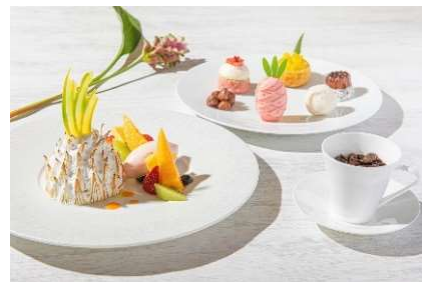
ハワイアンデザート、プティフル