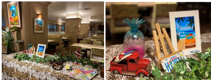
HILO KUME 氏のアートで装飾されたラウンジ

【メニュー・料金】・ヒロクメクッキー ¥1,500(数量限定) ・テイクアウトパフェ3種 各¥900他 ココナッツパインパフェ、アサイーベリーパフェ、 パッションマンゴーパフェ