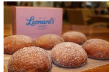
「レナーズ」マラサダ

【メニュー・料金】ハワイアンブッフェ ランチ 1名さま¥5,000より ディナー1名さま¥7,000より