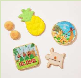
HILO KUME 氏の アートがプリントされた アイシングクッキー