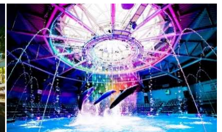
マクセル アクアパーク品川