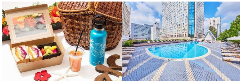
ハワイアンピクニックランチ、ステンレスボトル

・ローレン・ロス氏×Hydro Flask 品川プリンスホテル限定カラー ステンレスボトル(1名さまにつき1つ) ・「LUXE DINING HAPUNA」の朝食