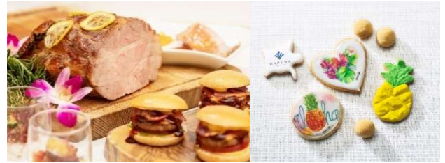
ハワイアンブッフェ