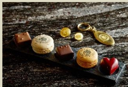
チョコレート&マカロン