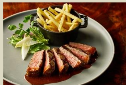
本場アメリカを彷彿とさせるステーキ

※プリフィクスランチ(¥5,800)に追加料金(+¥3,000)でお楽しみいただけます。