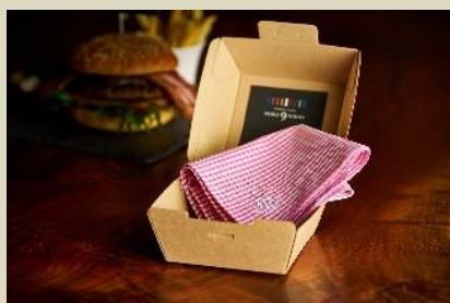
ハンバーガーケースに入った 当コラボレーションオリジナルハンカチ

上記のコラボレーションメニューをご注文いただいた先着700組のお客さまに、当コラボレーション限定で製作した、『J.PRESS』のロゴ入りのオリジナルハンカチをプレゼントいたします。