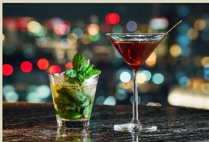
ホイッスルピッグミントジュレップ、 ホイッスルピッグマンハッタン(左より)