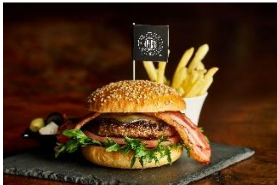
200gのパテを使用し、NYスタイルに、 迫力満点に仕上げたハンバーガー

食とファッションを融合させた特別な空間で、こだわりのお料理と共にくつろぐ大人の時間。ここだけでのみ体感できる“食のエンターテインメントスポット”の新たな魅力をご提供してまいります。