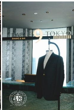
店内には『J.PRESS』の アーカイブ商品も展示