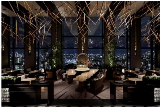
地上約140mから都心の景色を一望できる レストラン『DINING & BAR TABLE 9 TOKYO』