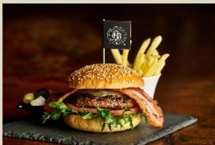
Hamburger “THE J.PRESS BOYS”

【メニュー・料金】 ・Hamburger “THE J.PRESS BOYS” ¥4,800 ・カクテル (1) ホイッスルピッグミントジュレップ (2) ホイッスルピッグマンハッタン 各¥2,700 ・チョコレート&マカロン ¥2,200