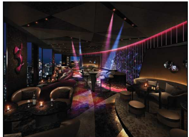
DJ サウンドバー(イメージ)

◎本件に関する報道各位からのお問合せは 株式会社プリンスホテル 高輪・品川マーケティング戦略 : 担当/中尾根、近藤、村澤 TEL: 03-3447-1133(直通) FAX: 03-3473-1115