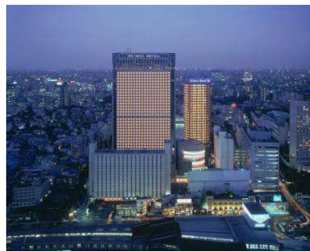
品川プリンスホテル

※上記記載内容は、2017年9月13日現在のものであり、変更となる場合がございます。