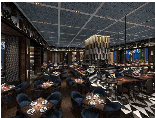
エキサイティング アーバンダイニング(イメージ)

このように、ホテル最上階 39F に“東京と遊び”をマッチングさせた新たなレストラン「Dining&Bar TABLE 9 TOKYO」をオープンすることで、品川の街の一大エリアを担うエンターテインメントホテルとして、街への更なる集客を図ってまいります。