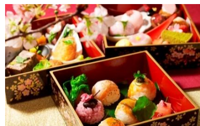
「高輪 花香路」眼下に日本庭園を望む和室(左)、人力車イメージ(右上)、はんなり小箱“SAKURA”(右下)