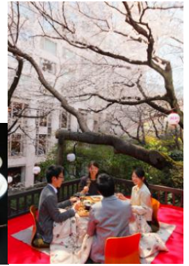
コース内容(左)と桜棧敷席(右)イメージ