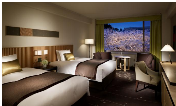
窓から桜を眺められるデラックスツイン

【お客さまからのお問合せ・ご予約】 TEL:03-5798-1111 宿泊予約係 ※2日前3:00P.M.までの予約制