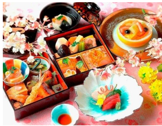
客室でご提供するお花見弁当 イメージ