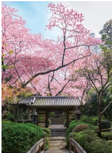
日本庭園の山門と桜

【庭園の桜】 約20,000㎡の日本庭園に咲く17種類約210本の桜は時期を違えて約3ヵ月間お楽しみいただけます。期間中は5:30P.M.～11:30P.M.に日本庭園をライトアップして幻想的な夜桜を演出いたします。