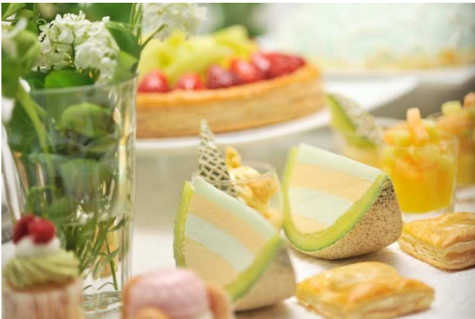
スイーツブッフェ『Green Garden Island』イメージ

ブッフェボードは、「幸福」を花言葉にもつ5月の誕生花スズランやクローバーのほか、ピンクのバラなどをあしらひ、新緑の庭をイメージしました。開放感あるラウンジで爽やかなティータイムをお楽しみいただけます。