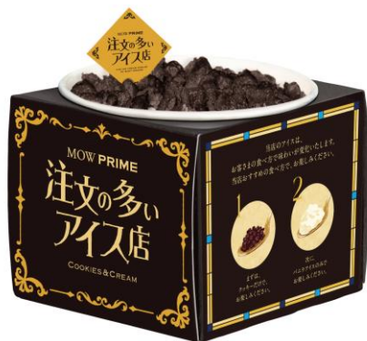
『MOW PRIME(モウ プライム) クッキー&クリーム(店舗特別版)』