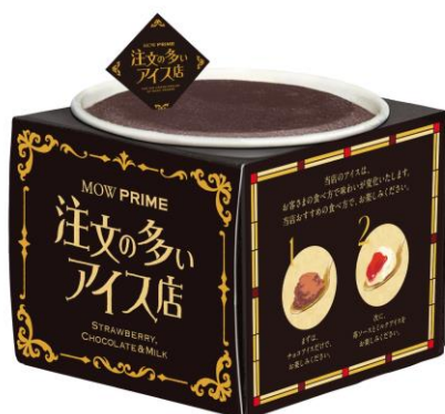
『MOW PRIME(モウ プライム) 苺ショコラミルク(店舗特別版)』