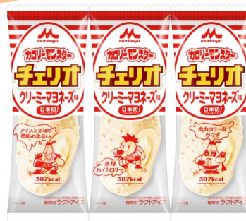
カロリーモンスターチェリオ クリーミーマヨネーズ味(1本入り) 希望小売価格:140円(税別) 内容量:85ml