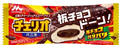
チェリオ バニラ(1本入り) 希望小売価格:140円(税別) 内容量:85ml