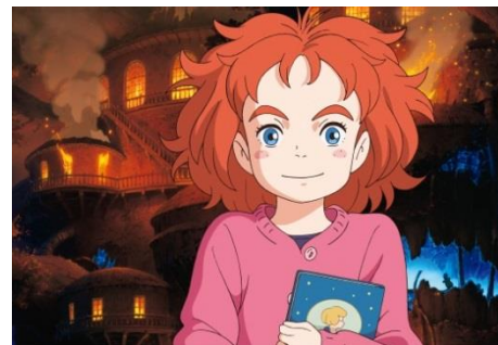
映画『メアリと魔女の花』より