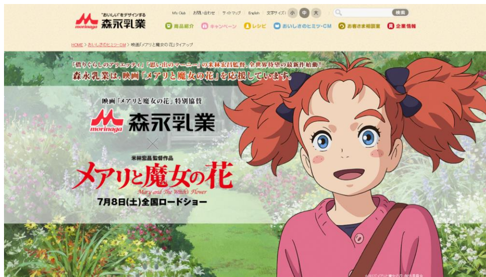
『メアリと魔女の花』特別協賛スペシャルサイト より

〈森永乳業×映画『メアリと魔女の花』特設サイト〉 http://www.morinagamilk.co.jp/mary/