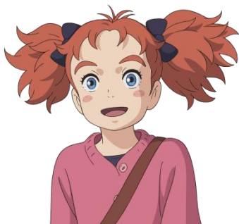
森永乳業の特別協賛を記念して描かれた、 映画の主人公・メアリの描き下ろしビジュアル

今回、この作品づくりの姿勢と想いに共鳴したことから、映画『メアリと魔女の花』に、当社としてブランドの垣根を超えた特別協賛・キャンペーンを実施することが決定しました。映画とのコラボレーションにより、様々な形で世代を超えて共有できる“ココロを動かす魔法体験”をお届けしてまいります。