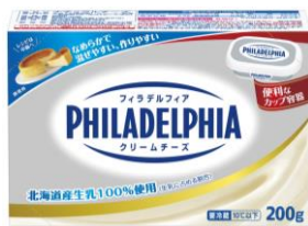
フィラデルフィア クリームチーズ

世界中で愛されて 140 年以上の歴史を持つ、伝統あるフィラデルフィアブランドのクリームチーズです。