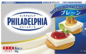
フィラデルフィア クリームチーズ 6P プレーン／香ばしオニオン