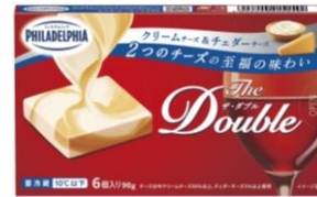
フィラデルフィア The Double 6P (クリームチーズ&チェダーチーズ)