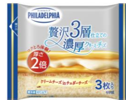
贅沢 3層仕立ての濃厚クリーミーチーズ