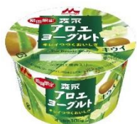
森永アロエヨーグルト キウイ

この撥水加工蓋が完成するまでに10年以上の月日を要しました。蓋が完成してからも高い撥水性を持つからこそこの課題が分かり、製品化に至るまでにはさらに1年もの時間を要しました。2010年2月に発売した「森永アロエヨーグルト キウイ」で初めて採用し、11年以上も使用しています。