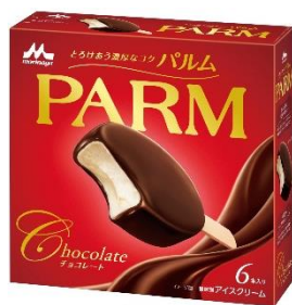
PARM(パルム) チョコレート(6本入り)