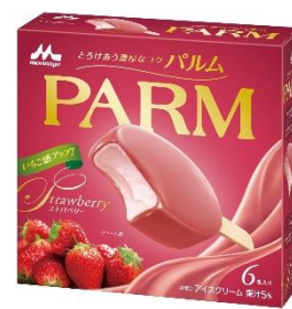
PARM(パルム) ストロベリー(6本入り)