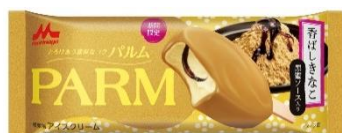
PARM(パルム) 香ばしきなこ(1本入り)