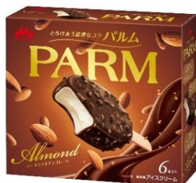
PARM(パルム) アーモンド&チョコレート(6本入り)