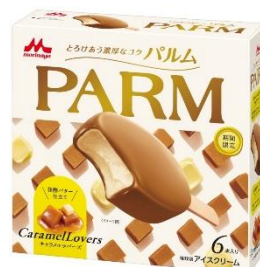
PARM(パルム) キャラメルラバース(6本入り)