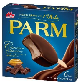
チョコレート&チョコレート ~厳選カカオ仕立て~(6本入り)