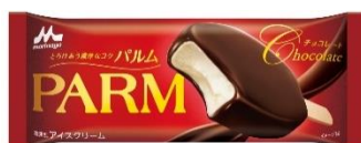
PARM(パルム) チョコレート(1本入り)