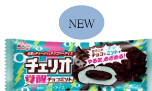
チェリオ 覚醒チョコミント 希望小売価格:130円(税別) 内容量:85ml