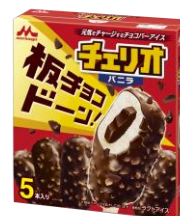
チェリオ バニラ(5本入り) 希望小売価格:オープン 内容量:50ml×5本