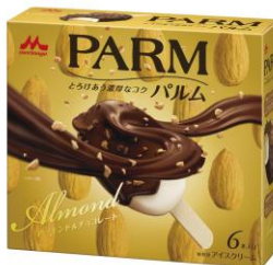
PARM(パルム) アーモンド&チョコレート (6本入り)