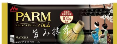
PARM(パルム) 旨み抹茶(1本入り)