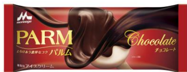
PARM(パルム) チョコレート(1本入り)