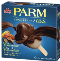
PARM(パルム) チョコレート&チョコレート ~厳選カカオ仕立て~(6本入り)