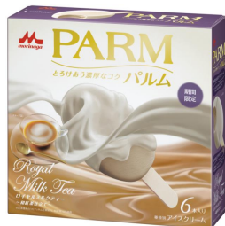
PARM(パルム) ロイヤルミルクティー ~和紅茶仕立て~(6本入り)