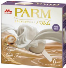
PARM(パルム) ロイヤルミルクティー ~和紅茶仕立て~(6本入り)