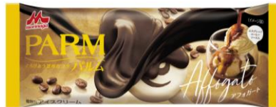
PARM(パルム) アフォガート(1本入り)