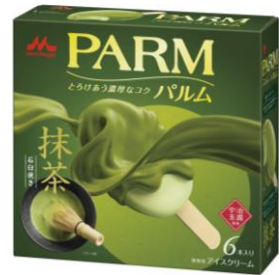
PARM(パルム) 抹茶 (6本入り)