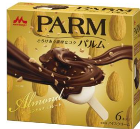
PARM(パルム) アーモンド&チョコレート (6本入り)