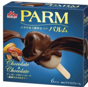
PARM(パルム) チョコレート&チョコレート ~厳選カカオ仕立て~(6本入り)