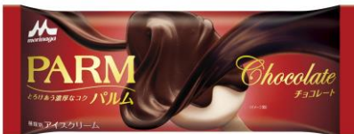
PARM(パルム) チョコレート(1本入り)