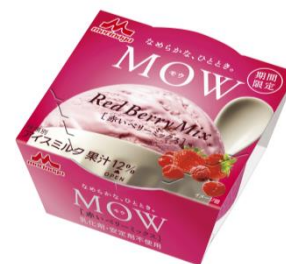
MOW(モウ) 赤いベリーミックス

品質本位の茶づくりに定評のある丸久小山園のまるやかな旨みの特徴の蔵出し抹茶を使用した緑色の宇治抹茶アイスと、当社が本製品限定に調達した“芳しい薫り”が特徴の焙煎抹茶を使用した薄緑色の宇治抹茶アイスの2種類を混ぜ合わせ、見た目の色や味の違い、調和がお楽しみいただけます。