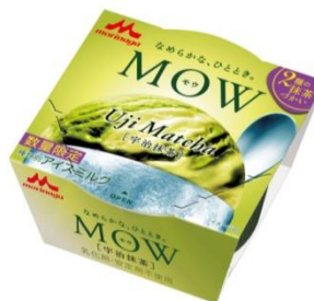
MOW(モウ) 宇治抹茶 (数量限定)

単一産地のカカオ豆のみ使用し、その個性あるカカオの味わいにこだわった「シングルビーンチョコレートアイス」です。エクアドル産カカオを100%使用し、特有の軽やかでフローラルな香りと、カカオの程良い苦みが楽しめます。