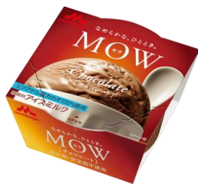
MOW(モウ) チョコレート ～エクアドルカカオ～

プレミアムアイスクリームでも使われる、国産の脱脂濃縮乳やクリームといった液状乳原料を使用し、濃厚でコクのある味わいが楽しめます。より芳醇なバニラの香りが広がる深みのある味を目指し、2017年3月にミルクとバニラの風味のバランスを改良しました。