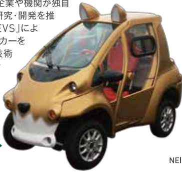
NEICLE Type II ▶

道内の自動車関連企業や機関が独自の技術を持ち寄り研究・開発を推進する「Team NEVS」による寒冷地仕様のEVカーをご紹介します。北海道の技術が集結した新たなコンセプトカーをぜひご覧ください。