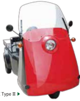
NEICLE Type III ▶