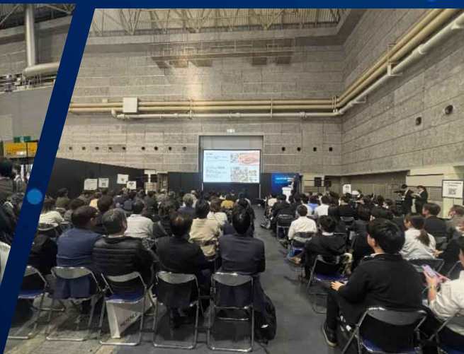
Japan DX Week 2025（大阪会場の様子）