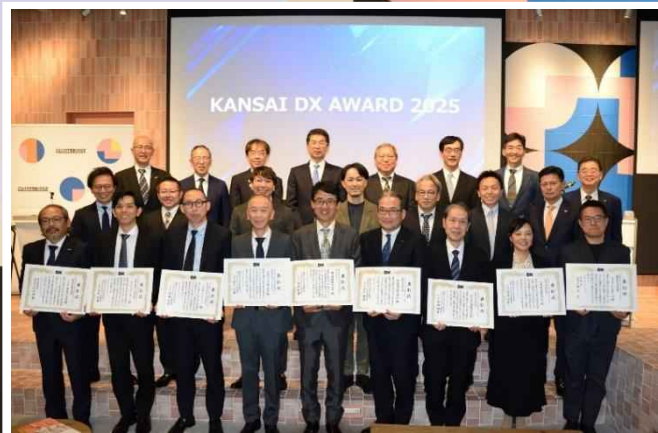
KANSAI DX AWARD 2025 表彰式