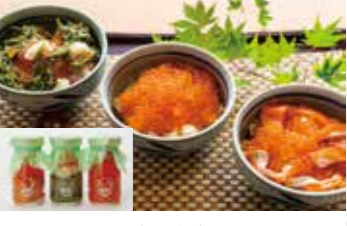
三陸産の豪華海鮮牛乳塩漬の宝ぶっかけどんぶり1人前 1,480円～ ぶっかけどんぶり(イートイン)1人前 1,508円～ 株式会社浄土ヶ浜パークホテル