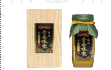
藤原黄金蜂蜜 桜の花550g 4,622円 藤原養蜂場