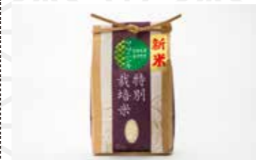
宮城県認定取得 特別栽培米 ササニシキ2kg 2,500円 みやぎ 齋田農園