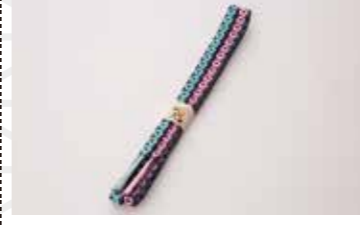
南部小桜組 帯じめ 約170cm 41,800円 組羅人