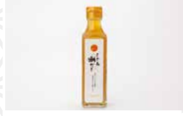
会津増川しじみ潮出し200ml 1,200円 会津かねじょう