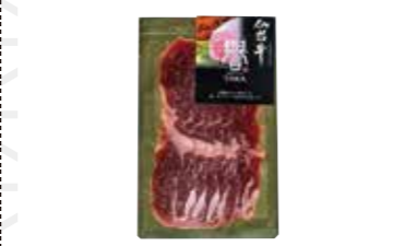
仙台牛生ハム1個50g 1,620円 鉄板ダイニング 響