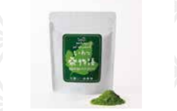
いわて桑物語桑の葉パウダー1個60g 1,000円 いわいの里