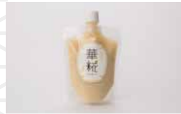
華粧(希釈タイプ)280g 777円 島津麹店