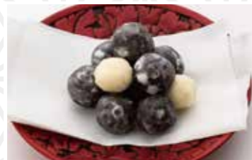
あんこ玉150g 450円 老舗 鳴海屋