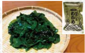
三陸産 おさしみわかめ200g 648円 川村海産