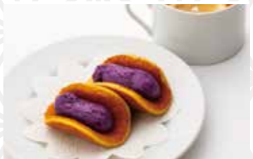
ガーデンハックルベリーどら焼3個 486円 高千代