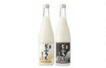
遠野どぶろく720ml 1,944円 宮守川上流生産組合