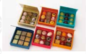
仙台ごこち きよせ9個入 750円 仙台駄がし本舗 日立家