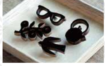
漆塗ブローチ各種1個 1,760円 Iwayado craft / 岩谷堂タンス製作所