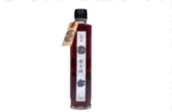
ガーデンハックルベリー飲む酢200ml 1,188円 江刺自動車学校 えさしベリー