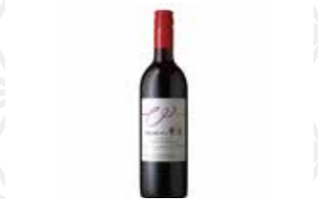
紫波ヤマソビニオン750ml 1,430円 自園自醸ワイン 紫波