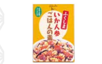
ふくしまいかん参ごはんの素172g 583円 ふうどまにふあくちゃあ まるい