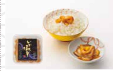
塩釜の澤塩仕込みのいか塩辛100g 648円 いかの塩辛本舗 平塚商店