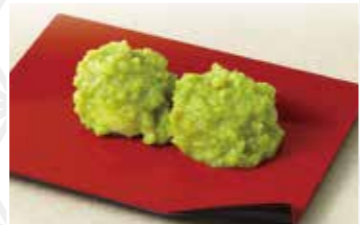
ずんだ餅6粒 780円 もちべえ