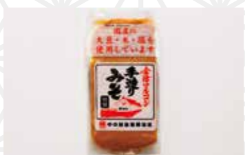
会津マルコシ手造りみそ750g 950円 中の越後屋醤油店