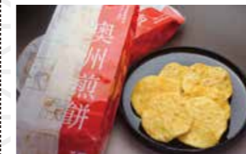
奥州煎餅 三色18枚入り 756円 奥州せんべい専門店 せんや