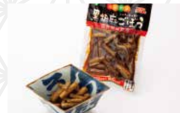
黒胡麻ごぼう1パック150g 302円 山吉青果食品