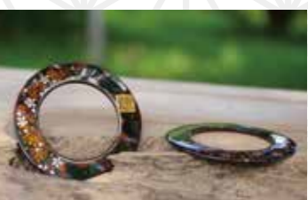
JAPAN IRON ペンダント25g 19,800円 流工房