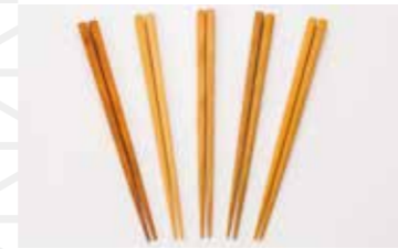
会津の木箸1膳 1,100円 木の店ステラ