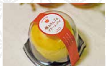
極みりんごのクリームパン1個 350円 サンファーム チェリー&ベリーガーデン