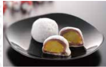
栗本陣(和菓子)2個入り 430円 ニュー木村屋