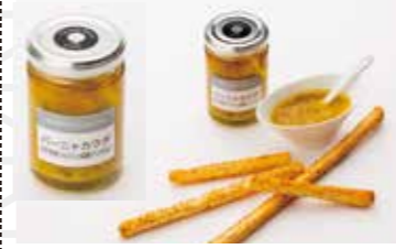
パーカウダ岩手県産にんにくと塩アランチョビ120g 990円 大西ファーム