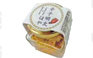
辛子明太ほや60g 850円 ヤマナカ