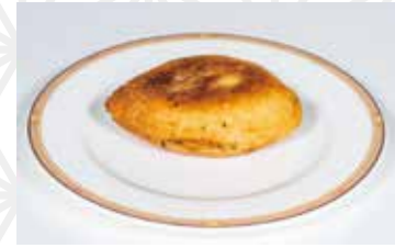
ピロシキ1個 500円 ロシアハウス