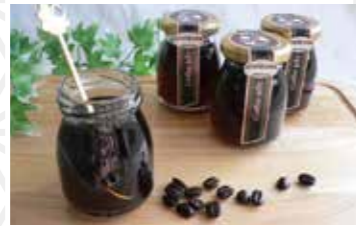
深煎り珈琲ゼリー100g 385円 明陽食品工業