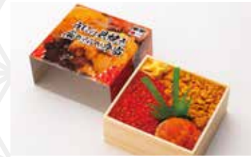
うに貝焼き食べくらべ弁当1折 1,379円 小名浜美食ホテル