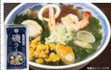
いわて北三陸磯ラーメン2食 756円 古館製麺所