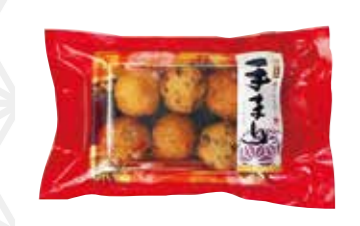
極上揚げかまぼこ手まり6種各1個入り 700円 いわきのかまぼこ 貴千