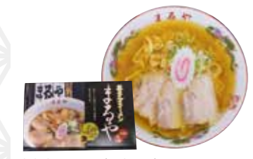
喜多方ラーメン(5食入り) 1,404円 喜多方醤油ラーメン(イートイン) 825円 老麺 まるや