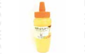
国産はちみつ500g 2,700円 鈴木養蜂場