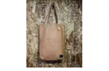
TKG オールレザーバッグ 88,000円 岩手革