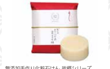
無添加手作り化粧石けん 故郷シリーズ 宮城県気仙沼産椿石けん100g 2,750円 樹-itstuki