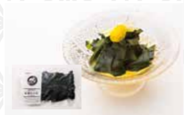
YORIISO 黒潮わかめ100g 702円 マルキ遠藤