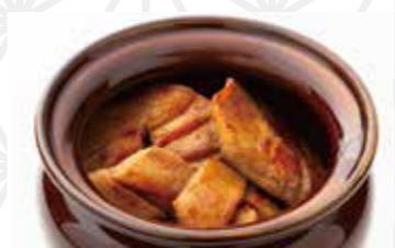
たん兵衛名物 元祖牛たん壺飯350g 1,944円 牛屋 たん兵衛