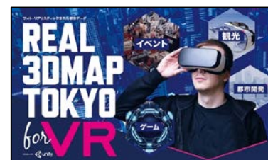
株式会社 Gnomon VR体験「REAL 3D MAP TOKYO VR」