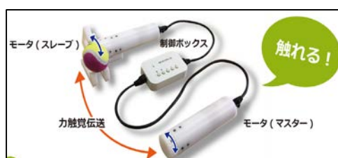
モーションリップ株式会社 世界最小のリアルハプティクス装置 「ポータブル力触覚デバイス」