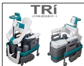
株式会社 MICOTO テクノロジー TRi (立位作業・就労支援ロボット)

3つの展示分野に加え、関係する3テーマ(レジリエント/AR・VR/IBM Watson)をプラスし、それぞれのテーマ毎に先進的な技術をもつ企業の展示・体験企画などを実施します。