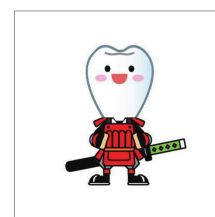
歯っぴー株式会社