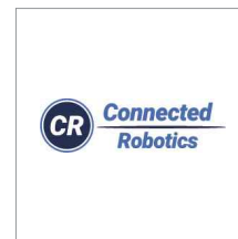
コネクテッドロボティクス 株式会社