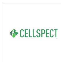
セルスペクト株式会社