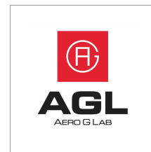
株式会社エアロジーラボ