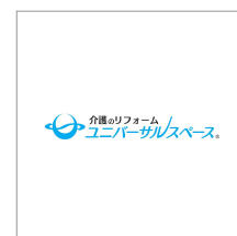
株式会社ユニバーサルスペース