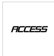
株式会社アクセス