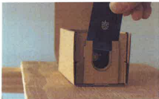
マスキングテープアートが描ける アートツール「mt ナゾリエ」

剥がしても跡が残らないマスキングテープを利用するため、賃貸住宅でも気軽に使うことができ、月ごと、季節ごと、イベントごとに模様替えをするように日常的に変化を楽しむことができます。