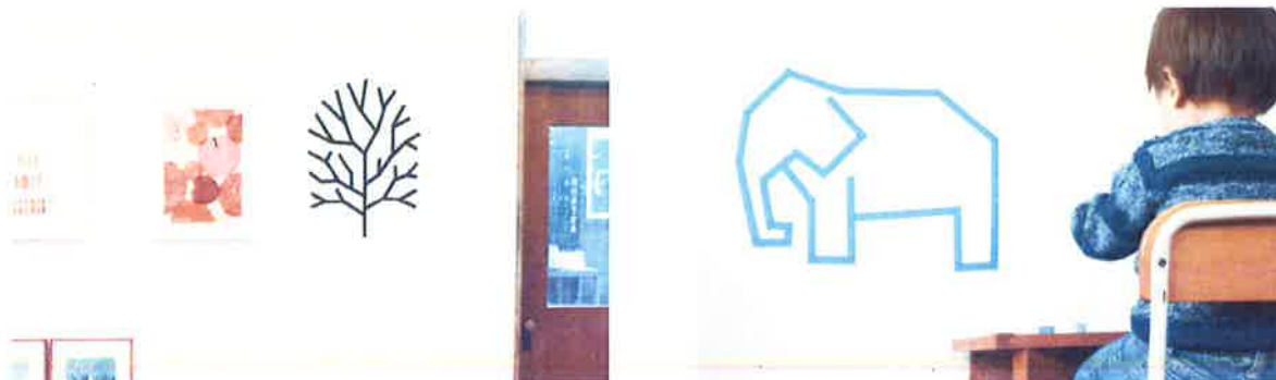
絵柄は、幾何学模様、花、動物、 サイン表示、季節のイベントなど多種多様。