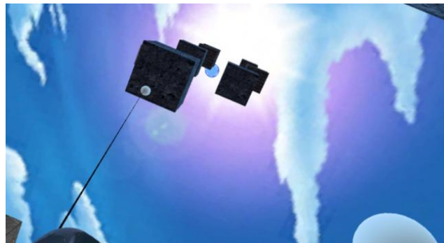
VR アカデミー賞作品動画