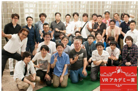
VR アカデミー・オーディション風景

4月1日御茶ノ水での開校イベントを皮切りに、3ヶ月の実践学習がスタート。5月末VRハッカソン、そして、6月末の最終回は、修了課題制作発表会(Vアカ・オーディション)を実施。更に、7月末一般公開イベント「東京VRコンテンツfes.2017」を開催。第一期生の全VR作品を出展、大盛況を博し無事修了致しました。