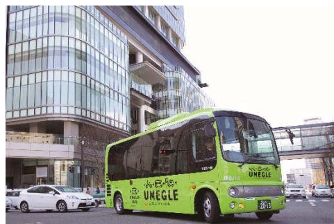
写真は通常のうめぐるバス