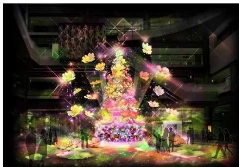
▲ 上) 通常時 下) ライトアップショー時 北館1Fナレッジプラザ メインクリスマスツリー「Timeless Blossom」 11月9日(水)に点灯式を開催予定。(別途ご案内予定)