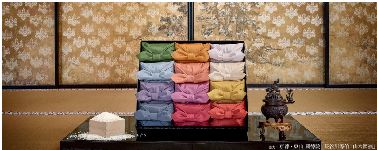
協力：京都・東山 圓徳院 長谷川等伯「山水図襖」

https://www.okomeya.net/info/giftservice/houmeichou