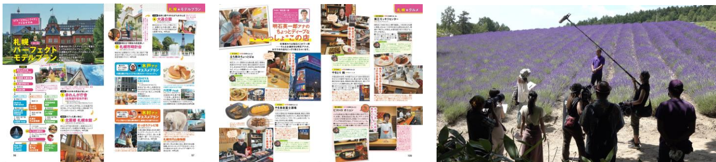
「どさんこワイド」とのコラボ取材で地元情報を詰め込みました