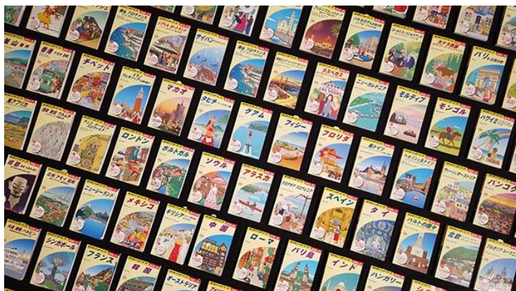
現在120タイトルの海外ガイドブックを発行

・URL: https://www.arukikata.co.jp/guidebook/series/