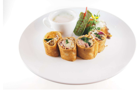
手島竜司シェフ監修「そば粉のガレットきのこ とベーコン」 Paris「PAGES」より