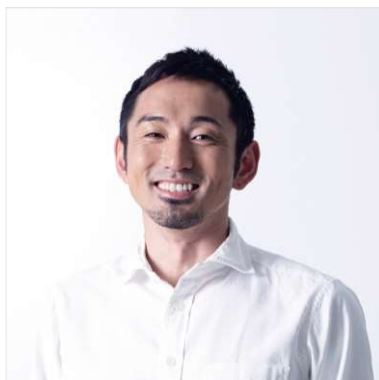
為末 大 氏