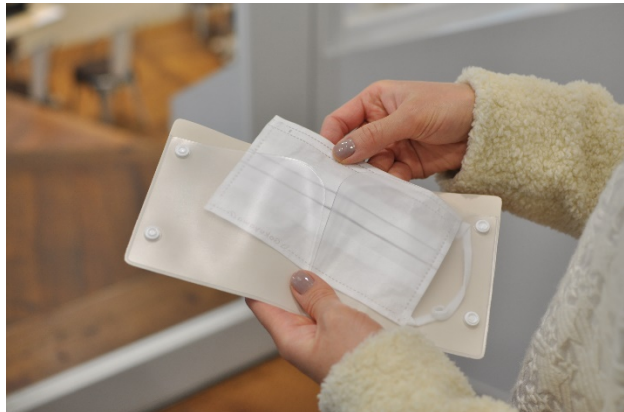
内側の半透明のスリットに、外したマスクを差し込みます。