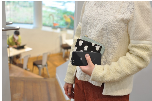
スマホやお財布などと合わせて持ってもかさばらない薄型で、バッグの中でも邪魔になりません。