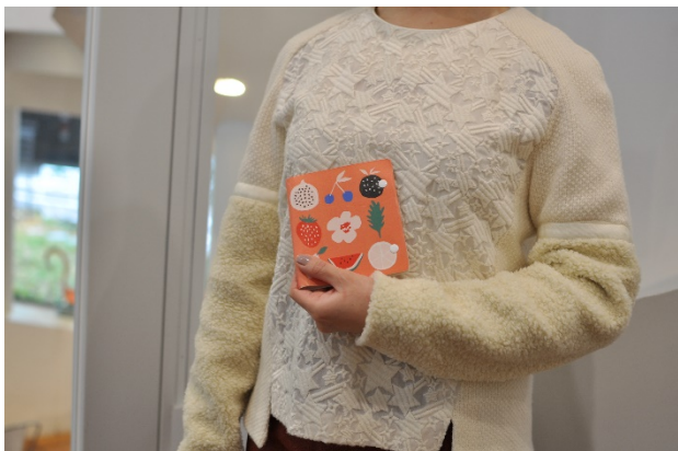
ちょうどハンカチくらいのコンパクトなサイズ感。