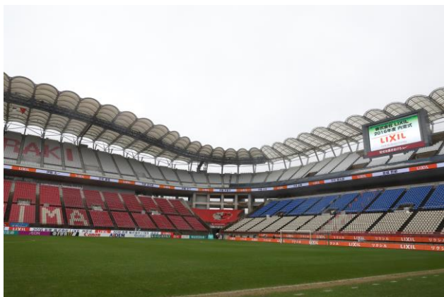
<内定式会場(カシマサッカースタジアム)>