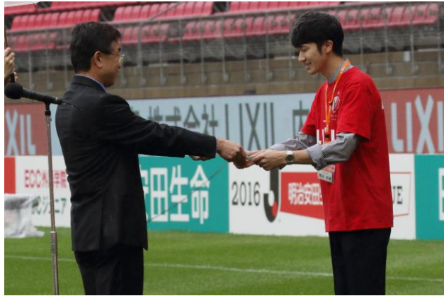
<誓いの言葉(代表者1名)/代表者5名によるサッカーボールシュート>