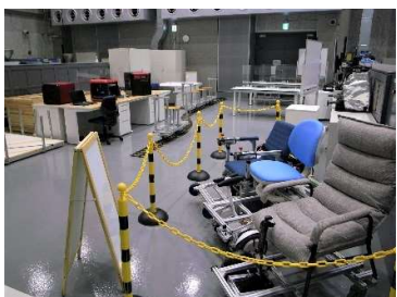
生産プロセス実験室