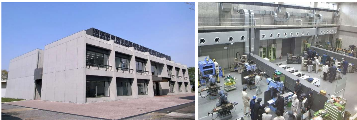
<写真 1 (左)：総合実験実習棟の外観、写真 2 (右)：2 階吹き抜け部より 1 階工場部分を望む>

埼玉工業大学（本部：埼玉県深谷市、学長：内山俊一、略称：埼工大、 https://www.sit.ac.jp/ ）は、DX 時代のスマートファクトリーへ対応するエンジニアの育成に向けた最新の教育・研究施設として、工学部機械工学科の総合実験実習棟（通称：スマートデザインファクトリー）を今年度より稼働開始しました。