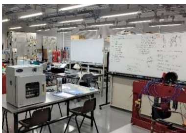
熱エネルギー工学実験室