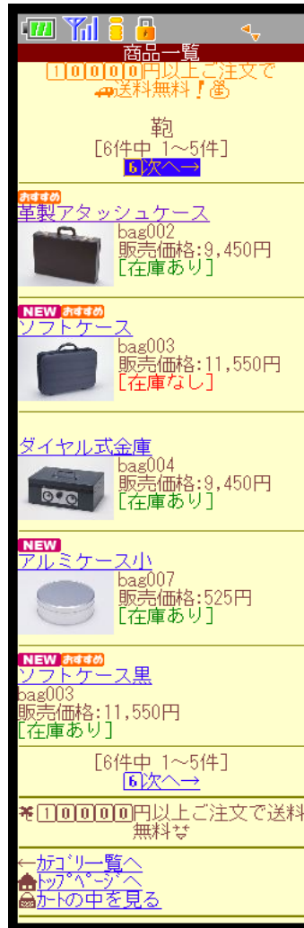
ケータイ用サイトデザイン画面。3キャリア共通の絵文字や商品のサムネイル画像の表示が可能になり、オリジナリティ溢れるページが作成できます。