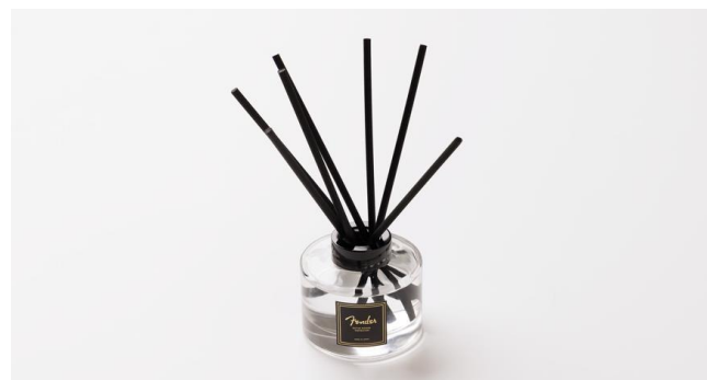
Fender Guitar Woods Inspiration