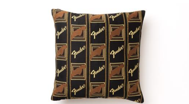
Fender Pillow Cover Monogrammed BK/YW/BR