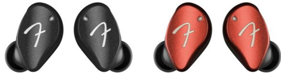
Fender Audio™ Tour True Wireless Earbuds