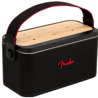
Fender Audio™ RIFF™ Bluetooth Speaker

旗艦店オリジナルグッズの他にも、世界中のミュージシャンやアーティストに愛されるフェンダー独自の機能が満載の Bluetooth スピーカーやワイヤレスイヤフォンなど取り揃えています。