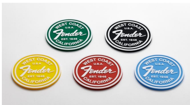
Fender West Coast Logo Coaster (5種)