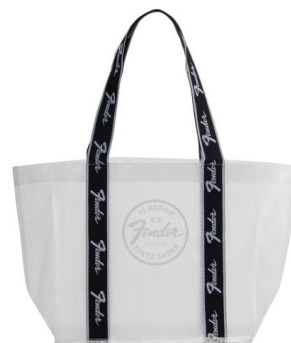
Fender Flagship Tokyo Eco Shopper Bag