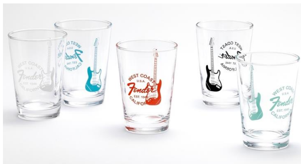
Fender West Coast Logo Glass (5種)