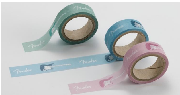
Fender Masking Tape (3種) (予定売価：各 550 円 (税込))