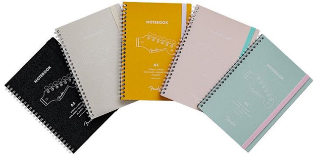
Fender Ring Notebook (5種) (予定売価：各 880 円 (税込))