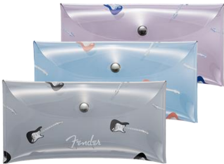
Fender PVC Case (3種) (予定売価：各 1,320 円 (税込))

旗艦店では、楽器だけでなく、フェンダーそして音楽を愛する方に向けたファッション及びライフスタイルグッズをご用意しています。