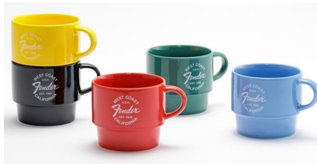
Fender West Coast Logo Mug (5種)