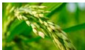
国産コメ圧搾オイル ※6