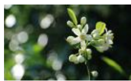
国産甘夏ネロリ花エキス ※7