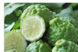
ベルガモット精油 ※3

天然のベルガモット精油 ※3 とカモミール精油 ※4 の心地よい香りと、その持続性を併せもつデュアルフレグランス処方。つける瞬間に精油の香りが立ちのぼり、その後は髪が揺れるとふんわり穏やかに香ります。