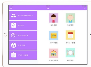
園長画面 園の管理を中心インタフェース