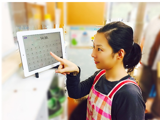
タイムカードではなく、アプリに出勤登録中の保育士 ※Sky保育園

個々の保育園に向けた柔軟なカスタマイズが可能な構成を特徴とするサービスで、すでに複数の園で運用が開始されています。