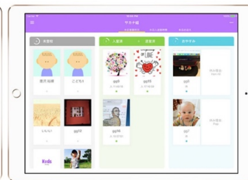
保育士画面 園児の登園状況を中心インタフェース