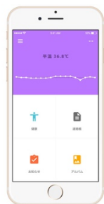
保護者トップ画面