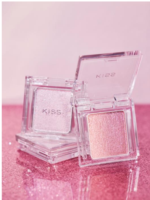
左から 01 フローズンアイリス 51 メタモルロゼ

3Dパール配合で絶妙な光と影を引き出し、目もとに自然な立体感を生み出す “KiSS”のグリッターアイカラーにビターロマンティックな限定色が登場！ 高輝度パールが、ひと塗りで主役級のきらめきをプラス。 濡れたようなツヤ感が、潤いのある瞳を演出します。 冬の寒空に、主役級のきらめきで目もとを華やかに彩ります。