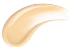
03 ライトベージュ イエロートーンの明るい肌色