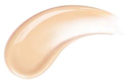
01 ライトオークル 明るい肌色