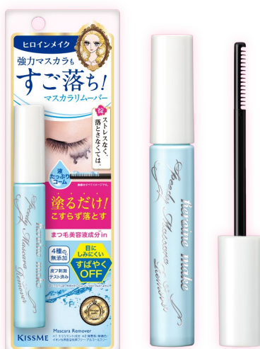
スピーディーマスカラリムーバー

株式会社伊勢半（本社：東京都千代田区、代表取締役社長：澤田 晴子）が展開する耐久アイメイクブランドヒロインメイクから発売中のマスカラ用リムーバー「スピーディーマスカラリムーバー」を含む、マスカラリムーバーシリーズが累計出荷数2100万本※ 2 を突破したことをお知らせします。 2025年6月～11月の実績値では、3秒に1本※ 1 売れている計算になります。