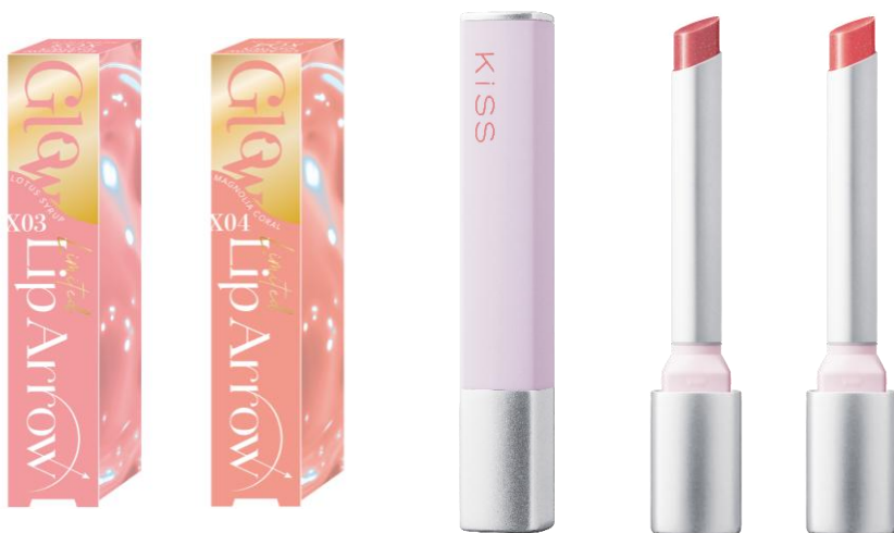
左から03 ロータスシロップ、04 マグノリアコーラル

とろけるような高保湿オイルベース処方で、メイクしながら唇をいたわる“いたわりリップ”設計。 うるおいをキープし、むっちりとした質感とちゅるんとしたトレンド感のある唇を叶えます。 輪郭を丁寧に描ける超極細※リップでまるでフィルターをかけたような、ピュアで可憐な春顔へ導きます。