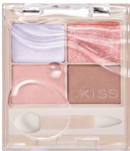
02 フラワーアクアリウム

血色感を仕込んだ「粘膜拡張カラー」で、 ナチュラルに大きな目もとを演出するアイカラーパレットから、 瑞々しい透明感のある可憐な印象に導く「フラワーアクアリウム」が数量限定で登場！ 「アクアリウム」の水のような透明感と水の中で揺らめく花のようなドリーミーな雰囲気イメージした、 キラキラとした肌馴染みの良い限定カラーです。 透明感&高発色を両立したカラー設計と、光を操る”うるきら”ラメが、 ちゅるんとうるんだ目もとを叶えます。