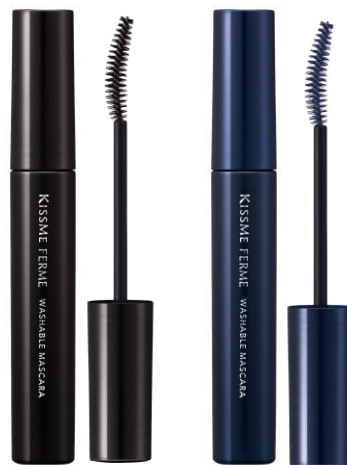
左から、01 ブラック、02 ネイビー

KISSME(伊勢半) 〒102-8370 東京都千代田区四番町6-11 TEL 03-3262-3123