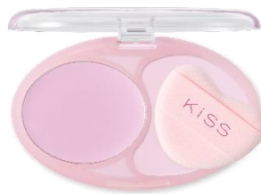
05 ミスティオーロラ