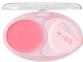
03 ウィスパーピンク