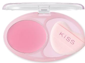
04 ソフティーベリー