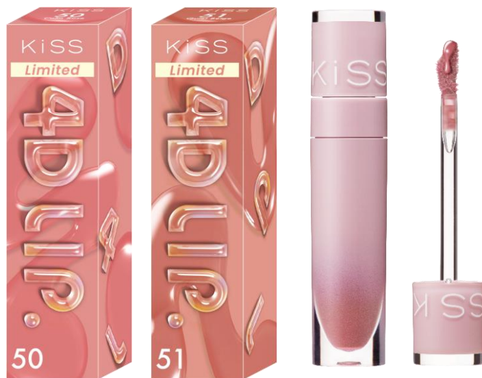
左から 50 カームローズ、51 クワイエットベージュ

美容液成分90%配合で、メイクしながら唇をうるおいで包み込み、まるで時空を超えたかのような、圧倒的に美しい仕上がりを長時間キープします。