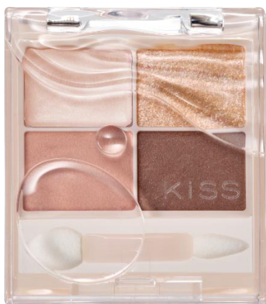
01 木漏れ日ミルクティー

木漏れ日が降り注ぐ森をイメージしたような、キラキラとした肌馴染みの良い限定カラーです。 透明感&高発色を両立したカラー設計と、光を操る”うるきら”ラメが、 ちゅるんとうるんだ目もとを叶えます。