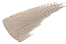
02 アッシュベージュ