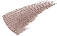
03 ミュートグレーージュ