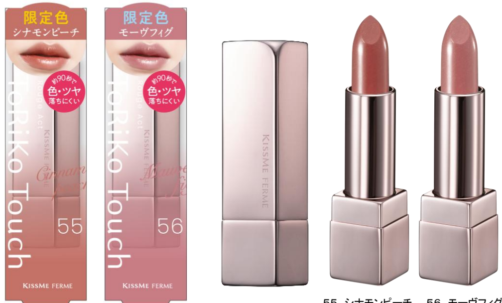
55 シナモンピーチ 56 モーヴフィグ

キスミー フェルムの「ルージュアクト」に、 ほんのり温もりのある「秋のフルーツティーカラー」が数量限定で登場。 肌になじむ魅力的な色合いのシナモンピーチとモーヴフィグが、顔印象をパツと明るく華やかに彩ります。 約90秒で色持ち+ツヤ感をロック！スルスルとなめらかな塗り心地で唇にフィットし、美しい発色を叶えます。